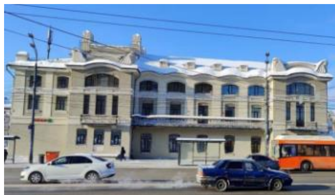
«Здание Второго Сормовского общественного собрания», 1904-1905 гг. (Нижегородская область, г. Нижний Новгород, ул. Коминтерна, 166 (литер А))