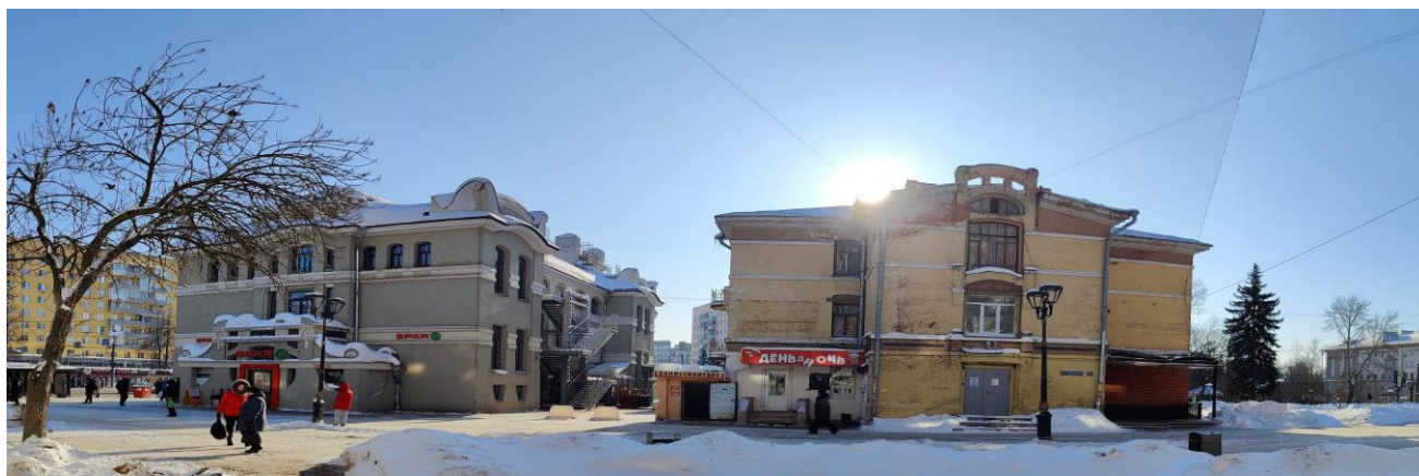
Объект культурного наследия регионального значения «Комплекс зданий АО «Сормово»», 1901-1903 гг., 1904-1905 гг. (Нижегородская область, г. Нижний Новгород, улица Коминтерна, 166 (литер А), улица Ефремова, 1 (литер А))